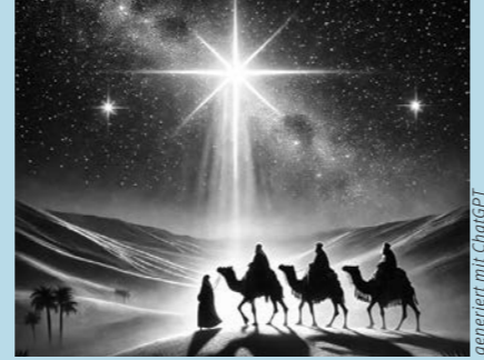
generiert mit ChatGPT

So sind mir auch die „Hl. Drei Könige“ auf meinem Weg hilfreich geworden. Sie haben ihren großen Auftritt erst nach dem Advent, am 6. Dezember. Aber ich stelle mir vor, ihr Weg bis zur Krippe hat sicher mehrere Wochen oder Monate gedauert. Sie mussten wohl manche schwierigen Wegstücke zurücklegen und raue, dunkle Nächte bestehen. Sicher haben auch sie erfahren, nur in der Nacht kann man die Sterne sehen. Die Sterne heben den